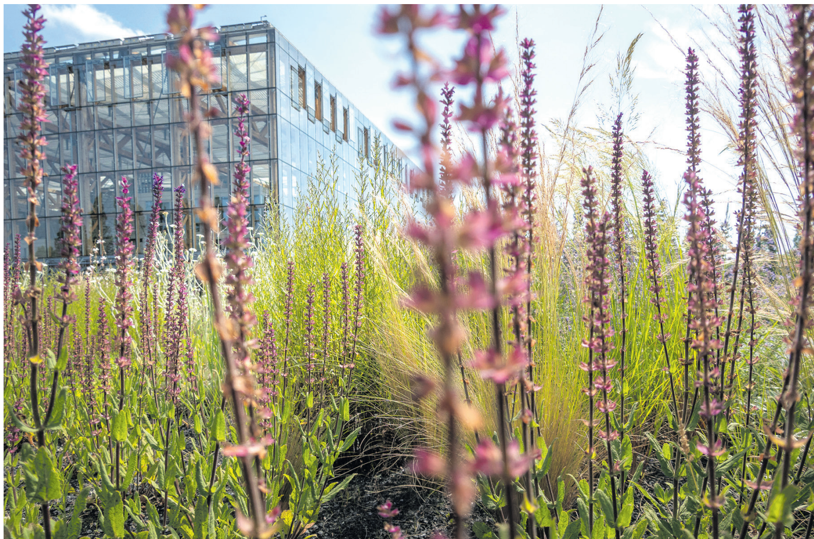
Es blüht und grünt zur schönen Jahreszeit.