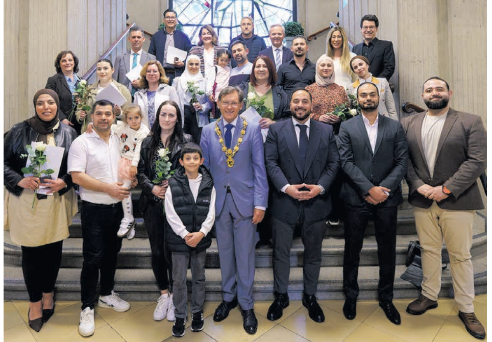
Im Rathaus hat der Empfang stattgefunden.