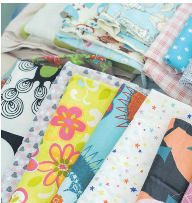
Das gemeinsame Nähen war eine Aktion, die Menschen zusammenbringen sollte.