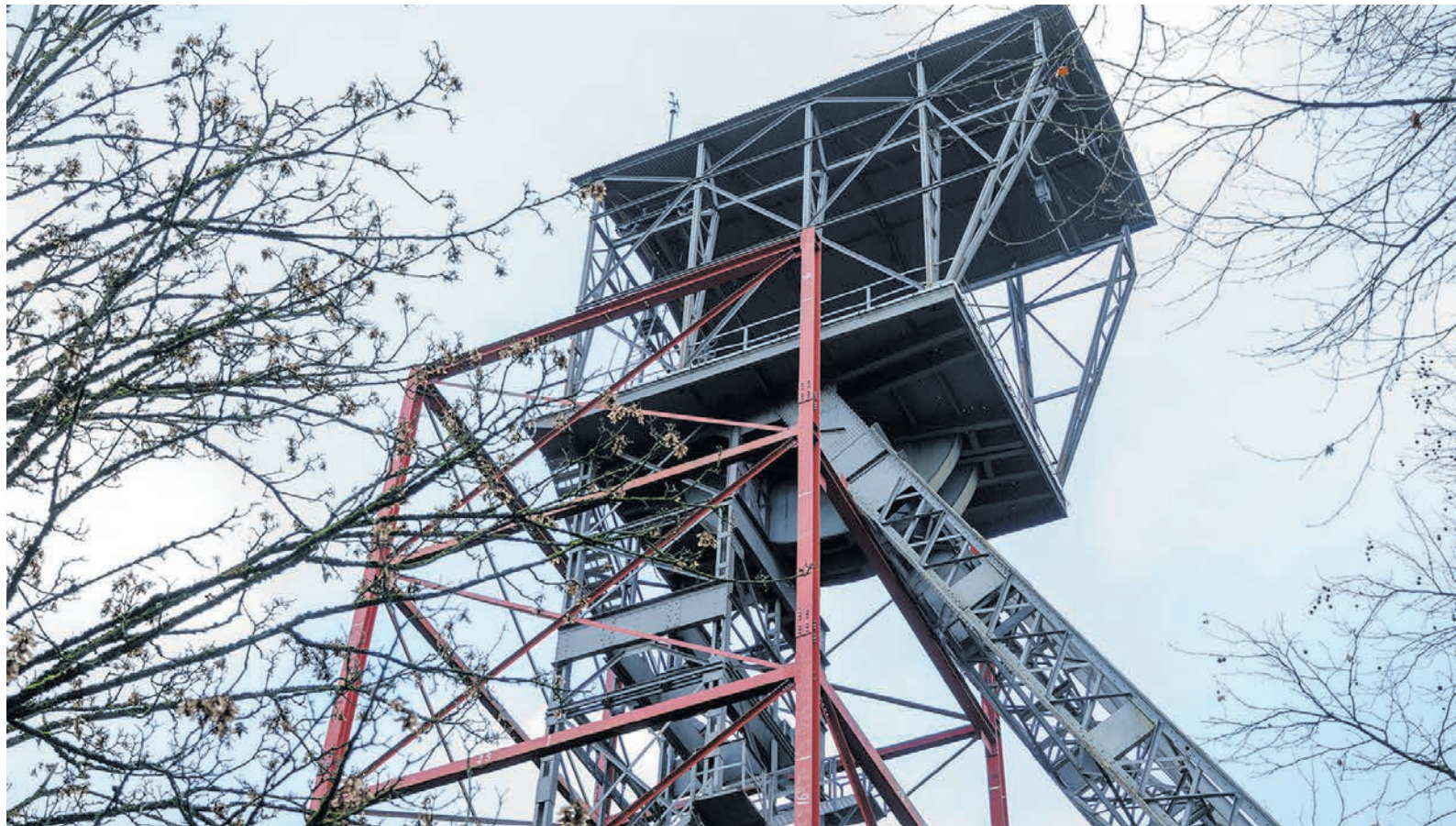
Die Arbeiten an dem stützenden Stahlkorsett sind gestartet.