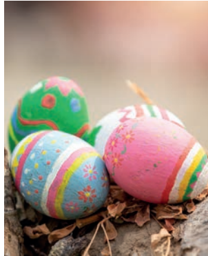
Auf die Eier - fertig - los!

Am Ostersonntag lädt die Mondritterschaft Wanne-Eickel e. V. in Kooperation mit dem Emschertal Museum ab 12 Uhr zur großen Ostereiersuche auf dem Gelände des Heimatmuseum ein (Unser Fritz Straße 108) Die Mondritter haben dazu selbstverständlich auch dem Osterhasen Bescheid gegeben und der hat versprochen, rund 500 bunte Ostereier zu verstecken. „Damit die kleinen Hasenfans nicht leer ausgehen haben wir einen ex-