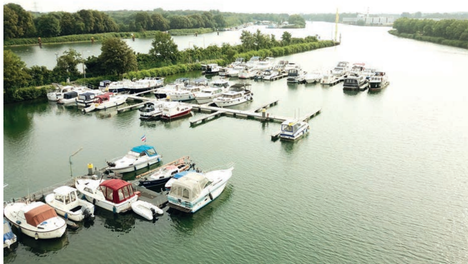
Wassersportfreunde - ob jung oder etwas älter - kommen beim 1. Herner Wassersportverein voll auf ihre Kosten!

jedoch noch ein wenig kalt ist, planen die Jugendlichen teambildende Maßnahmen, wie einen gemeinsamen Ausflug zum Movie-Park Germany nach Bottrop, eine Fahrradtour oder auch eine Kinder und Jugendparty im Vereinsheim. Für diejenigen, die schon immer einmal eine eigene kleine Yacht oder ein Sportboot steuern wollten, trainiert im Herner Yachthafen auch eine Bootsfahrschule für Jedermann. Interessierte am Ruder- oder Motorbootsport können sich im Netz unter www.wsv-herne.de über die Möglichkeiten im Verein informieren.