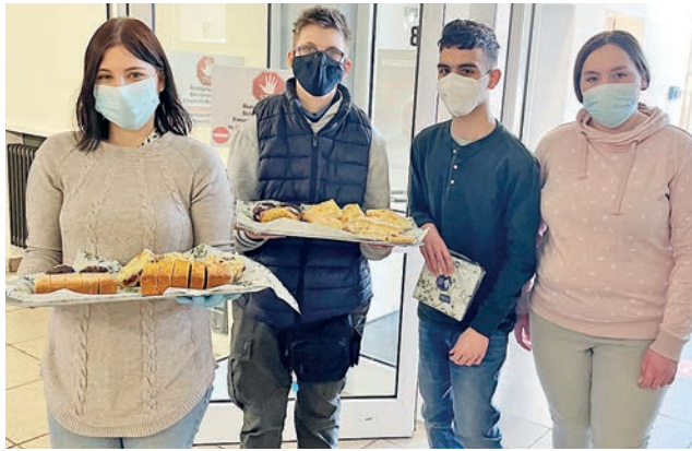
Kuchenverkauf für die Ukraine-Hilfe am Emschertal-Berufskolleg.