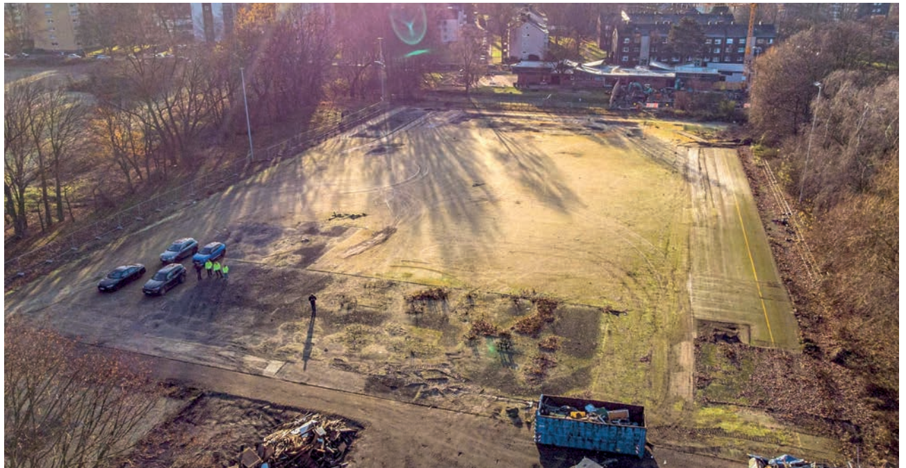
Das Gelände des ehemaligen Sportplatzes an der Forellstraße und die angrenzenden Flächen in der Übersicht von oben - Wohnungen, Geschäfte und Gastronomie sollen hier entstehen.

Die Vorbereitungen haben im Dezember begonnen. Mitte Mai 2022 sollen die eigent-